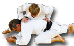
Je sais retourner Uke quand il est en position quadrupédique