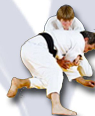
Je sais riposter quand je suis en position quadrupédique